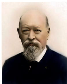
Franz von Suppé