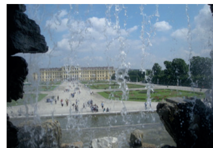
Castello di Schönbrunn, Vienna

Ussari, principesse, zingari baroni, mercanti cinesi ed ereditiere americane: un mondo variopinto raccontato da una musica brillante, sospesa nel tempo.